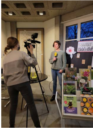
Pro Specia Rara