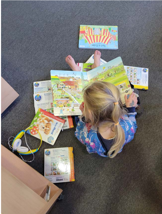
Lesemoment in der Bibliothek