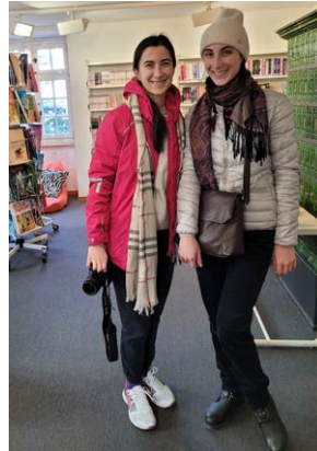
Besuch aus der Ukraine