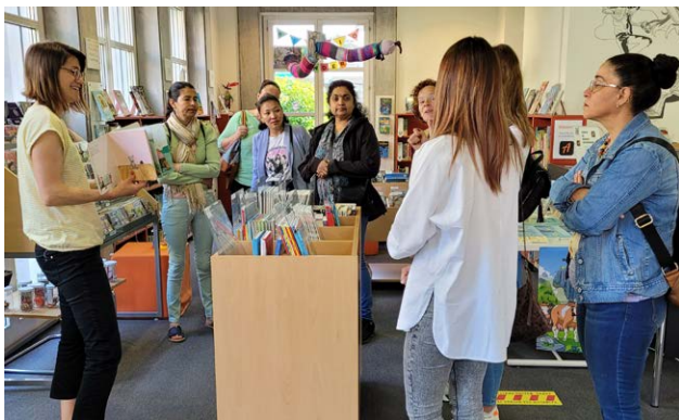
Frauentreff Sennwald zu Besuch