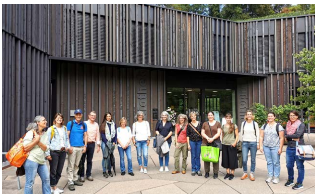
Bibliothek + Ludothek in Spiez